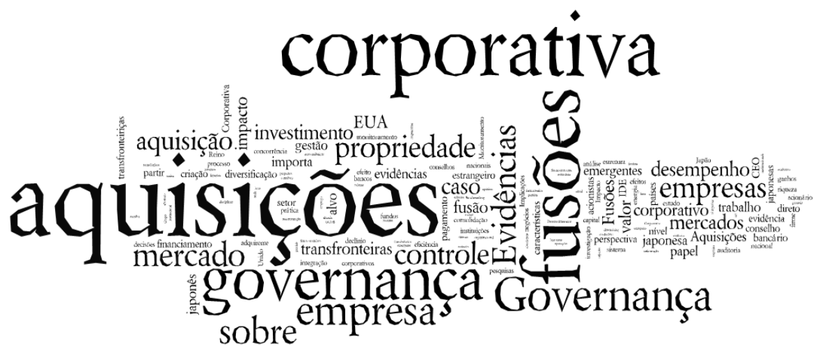
Figura 3 – Nuvens de palavras sobre Governança corporativa e Fusões/aquisições

Por último, foi elaborado a nuvem de palavras e para isso utilizou-se o programa WORDLE®, disponível on-line . Com os abstracts dos artigos analisados foi obtido um texto único que foi inserido no WORDLE e o resultado foi obtido na Figura 3, a seguir.