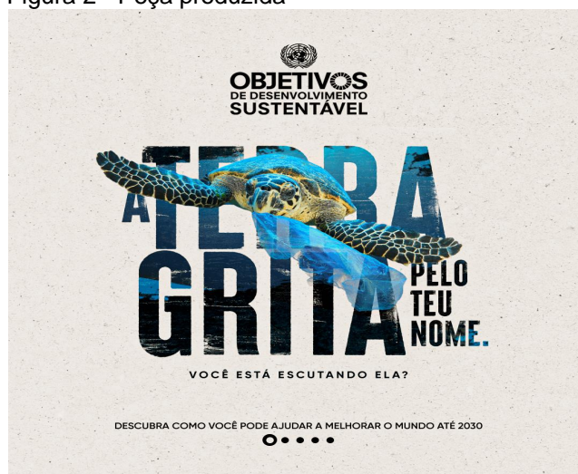
Figura 2 - Peça produzida