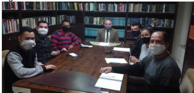
Figura 2 - Foto da entrevista