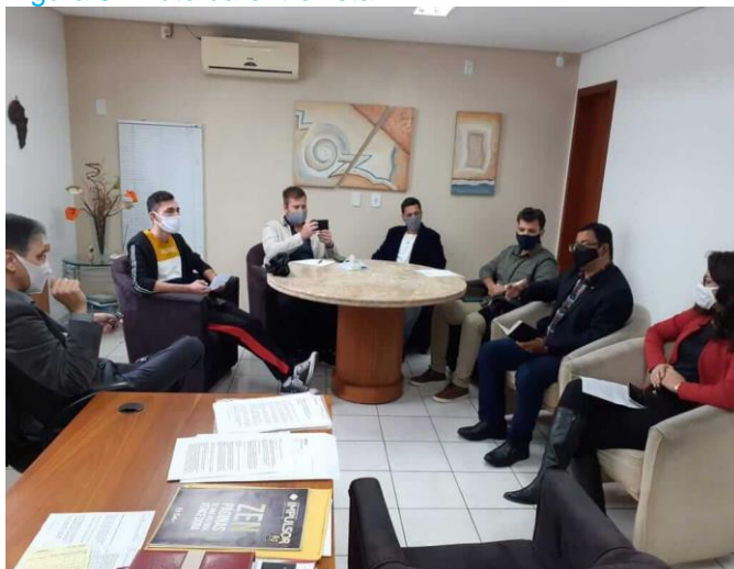
Figura 3 - Foto da entrevista