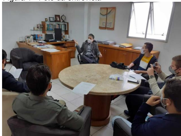
Figura 1 - Foto da entrevista

Como resultados da primeira etapa, foram apresentadas imagens dos encontros com os presidentes.